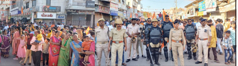
રાજુલા શહેરમાં ભગવાન શ્રીરામની ભવ્ય શોભાયાત્રા નીકળી હતી સાડા ત્રણ કિમિ લાંબી શોભાયાત્રા શહેરમાં પસાર થઈ હતી વિવિધ મંદિરોમાં પૂજા અર્ચના કરવામાં આવી હતી પોલીસ દ્વારા ચુસ્ત પીલીસ બંદોબસ્ત રાખવામાં આવ્યો હતો. આ તરફ રાજુલા શહેર ગ્રામ્ય વિસ્તારમાંથી ભાવિકો ઉમટી પડ્યા હતા.