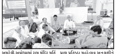
અમરેલી, અયોધ્યામાં રામ મંદિર મુર્તિ પ્રાણ પ્રતિષ્ઠા મહોત્સવ અનુવર્ધીને

અમરેલીના પ્રાચીન એવા રામજી મંદિરે અખંડ ધૂનનું આયોજન કરવામાં આવ્યું હતું. જેમાં ધૂન મંડળોએ અખંડ રામધૂનની રમઝટ બોલાવી હતી. ધૂન કાર્યક્રમમાં ભાવિકો મોટી સંખ્યામાં ઉમટી પડ્યા હતાં.