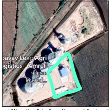
અમરેલી, પિપાવાવ લિપ એગ્રી લોજિસ્ટિક પ્રા.લી દ્વારા મોટા લીલીયામાં સરકારી

સરકારી પડતર પશુધન ચરીયાણની જમીનમાં પણ ગેરરિતી આચરતા કલેક્ટરને રજુઆત કરી : તપાસની માંગ ઉઠાવી