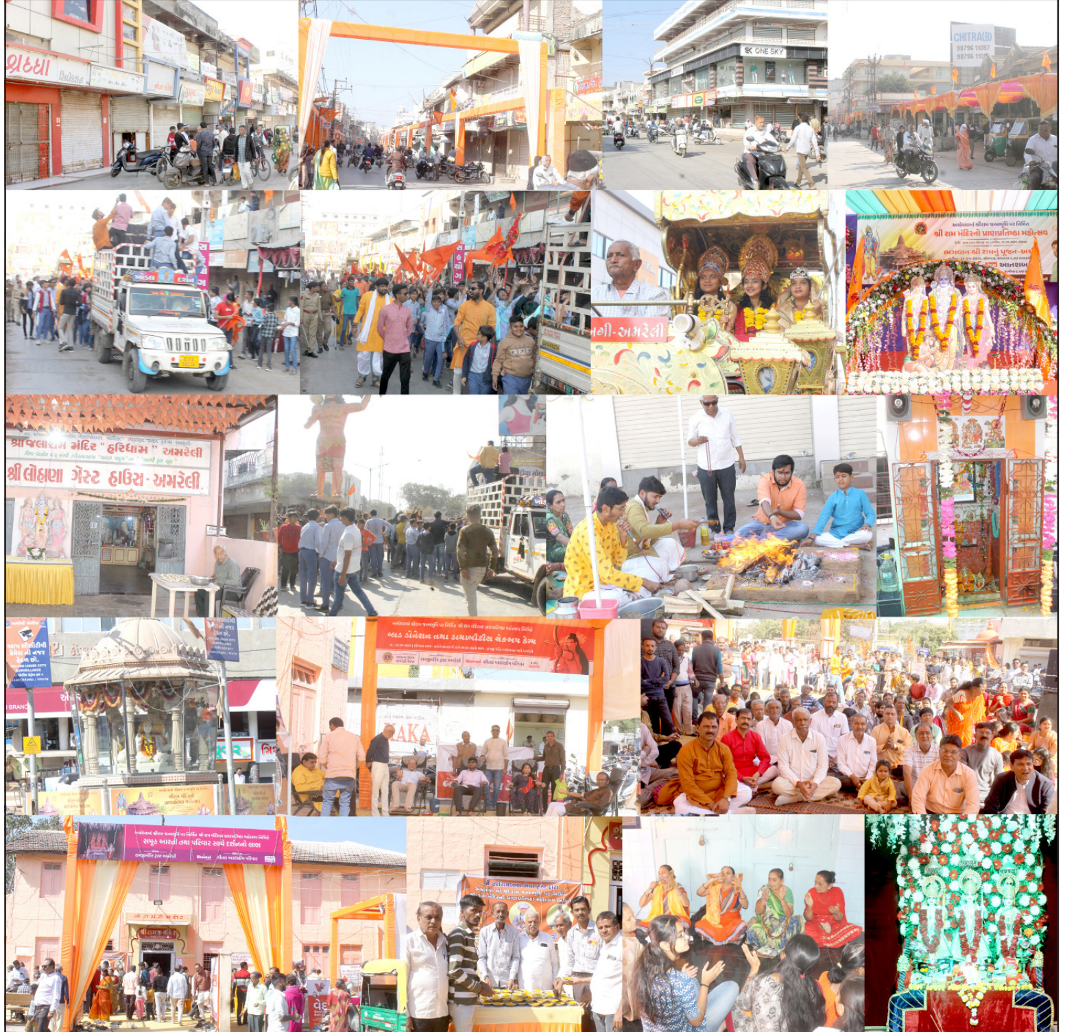
અમરેલી, અયોધ્યામાં રામ મંદિર મૂર્તિ પ્રાણ પ્રતિષ્ઠાને પગલે અમરેલીએ પણ નવીનવેલી દુલ્હનની જેમ સોળેશણગાર સજ્જ ભગવાનશ્રી રામના વધામણા કર્યા હતાં. અમરેલીના વેપારીઓએ પણ સ્વયંભુવંધ રોજગાર અંધરાખી પ્રતિષ્ઠા કાર્યક્રમનું લાઈવ પ્રસારણ નિહાળ્યું હતું. અમરેલી શહેરમાં ટેર ટેર ધણ પતાકા, કમાનો, ફટ્ટો સાથે ટેર ટેરથી ભગવાનશ્રી રામની વિરાટ શોભાયાત્રાઓ નિકળી હતી તેમાં રામ ભક્તો વિશાળ સંખ્યામાં જોડાયા હતાં. શહેરના રામજી મંદિરે ડાયાબિટીસ કેમ્પ સાથે રક્તદાન કેમ્પ યોજાઈ વપ્રસારણ નગાનાથ મંદિર રૂપમ નજીક પ્રસાદ, યજ્ઞ, પુજન અર્ચન, સહિત ધાર્મિક માહોલ જોવા મળ્યો હતો. એલ્બાઈસી ઓફિસ પાસે હનુમાનજી મંદિરે તથા તમામ મંદિરોમાં મહાઆરતી રામમય બન્યા હતાં. દિવસભર અનેરો કાર્યક્રમો યોજાયા હતાં. અને લોકો રામમય બન્યા હતાં. દિવસભર અનેરો ધાર્મિક માહોલ જોવા મળ્યો હતો.

અમરેલીમાં દરેક મંદિરોમાં હવન યજ્ઞ, પૂજન અર્ચન, મહાપ્રસાદ, આરતી, હનુમાન ચાલીસા અમરેલીના રામજી મંદિરે ડાયાબિટીસ કેમ્પ, રક્તદાન કેમ્પ સહિત સેવા કાર્યો ચોખવા સહિતના કાર્યક્રમોમાં જનમેદની ઉમટી: શહેરમાં વિરાટ શોભાયાત્રાઓ ડીજેના તાલે ચોખધ નવી નવેલી દુલ્હનની જેમ અમરેલી શહેરને સોળેશણગારથી ભાવિકોએ શણગાર્યું