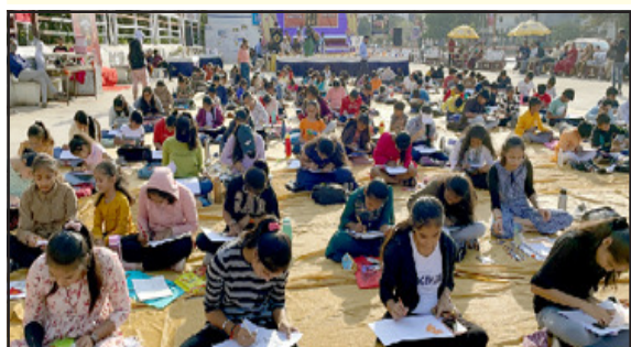
અમરેલી, અમરેલીમાં લાયન્સ ક્લબ પ્રતિષ્ઠા મહોત્સવ અંતર્ગત ભગવાન શ્રી રામના જીવન ચરિત્રને રંગોથી કંડારવા રોયલ દ્વારા અયોધ્યા જન્મ ભૂમિ પ્રાણ શ્રીરામ ઐતિહાસિક ચિત્ર સ્પર્ધા સીનિયર